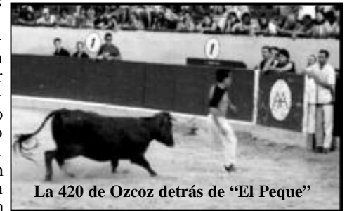
La 420 de Ozcoz detrás de "El Peque"

con sus embestidas. Como nota positiva me gustaría reseñar que la vaca estuvo muy en tipo de lo que se entiende por Casta Navarra. Creo que era una vaca como para obtener alguno de los premios la pareja. 0 anillas.