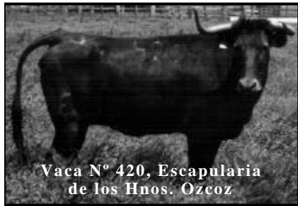
Vaca N° 420, Escapularia de los Hnos. Ozcoz

Esta pareja tampoco se confió con la vaca que les tocó en suerte. La vaca tardó en espabilar pero cuando se calentó acudió a los recortes, lo hizo con nobleza y “dejándose”. Esto no lo supo aprovechar la pareja y aunque sí que la recortaron, no se acercaron al pitón, cosa imprescindible para conseguir anillar. La vaca tuvo un comportamiento bravo y creo que la pareja si podría haber conseguido alguna anilla.